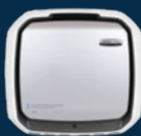
AM Pro III