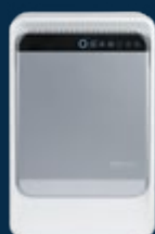
AM Pro II