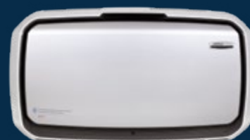
AM Pro IV