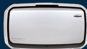
AM Pro IV