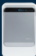
AM Pro II