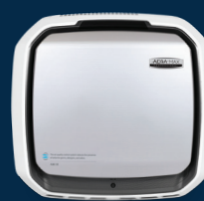
AM Pro III