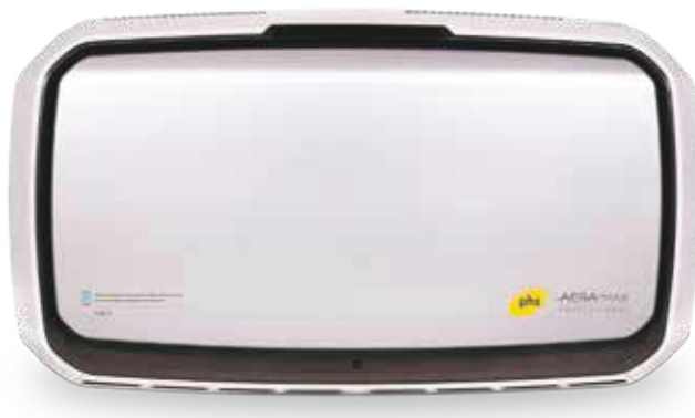
AeraMax® Pro IV (SKU 9451001)

Ogólnie rzecz biorąc, personel zarządzający w Village Hotel był pod wrażeniem szybkiego pozytywnego oddziaływania AeraMax® Professional na jakość powietrza w pomieszczeniu fitness. Urządzenie zostało zainstalowane w strategicznej lokalizacji siłowni, co oznacza, że jego beneficjenci mogą cieszyć się zdrowszym i bardziej higienicznym powietrzem podczas treningów.